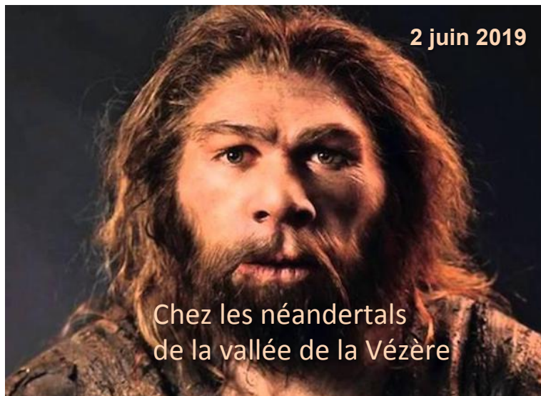
reconstitution et cliché Élysabeth Daynès

Ce dimanche sera l'occasion grâce à Brad Gravina et Alain Turq, de nous rattraper en visitant deux sites importants dont Le Moustier qui a donné son nom au fameux Moustérien.